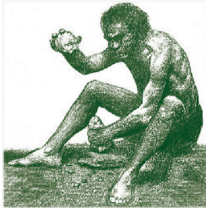
Abb: Neandertaler beim Semmelbrösel machen